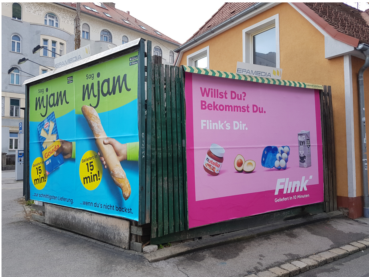
Abbildung 2: Delivery Werbung in Graz, April 2022