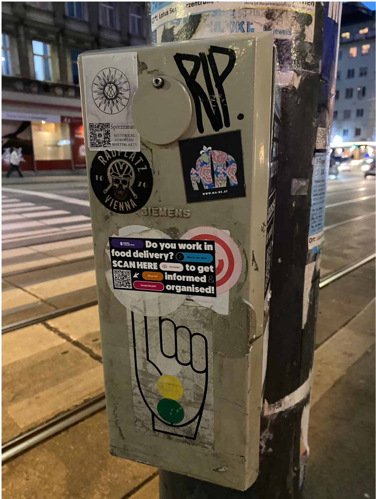
Abbildung 1: Sticker am Gürtel in Wien, März 2025